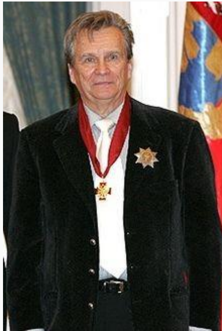
Владимир Федосеев на вручении ордена «За заслуги перед Отечеством» II степени (21 декабря 2005)